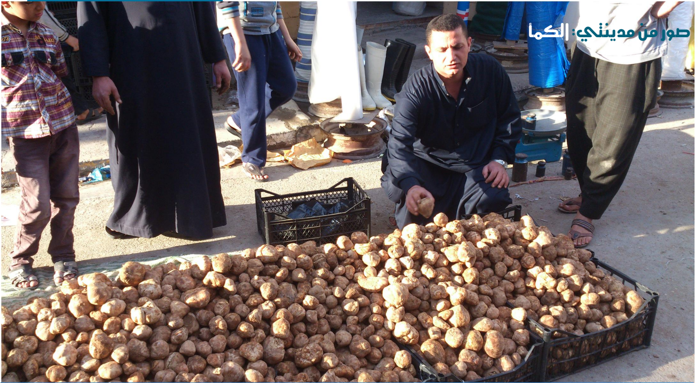
الكما في سوق هيت ٢٠١٤