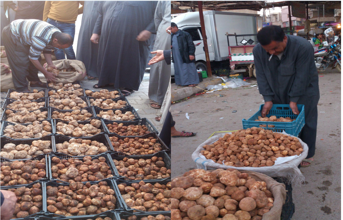
الكما في سوق هيت ٢٠١٤