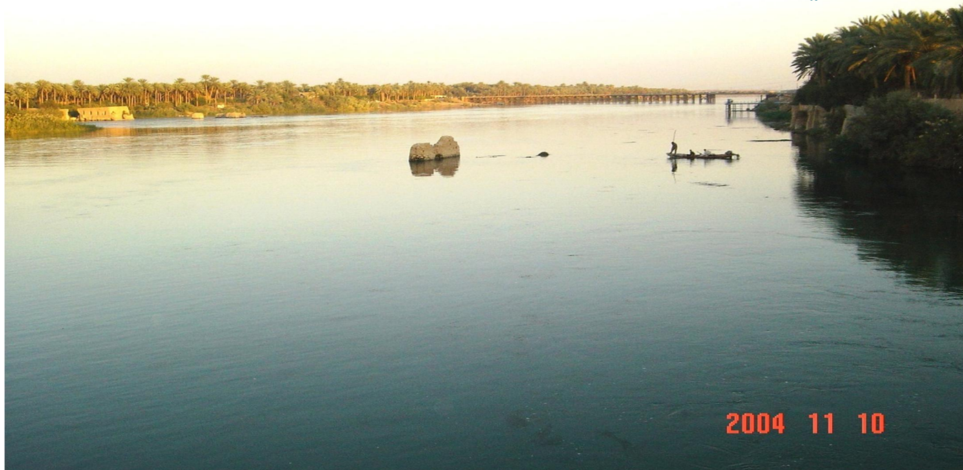
نهر الفرات عام ٢٠٠٤