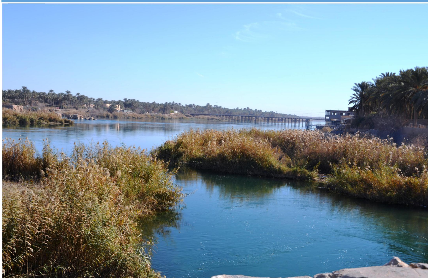
نهر الفرات عام ٢٠١٢

المصادر: ١. بوساطة محمد خيرى كريم. (٢٠١٣).