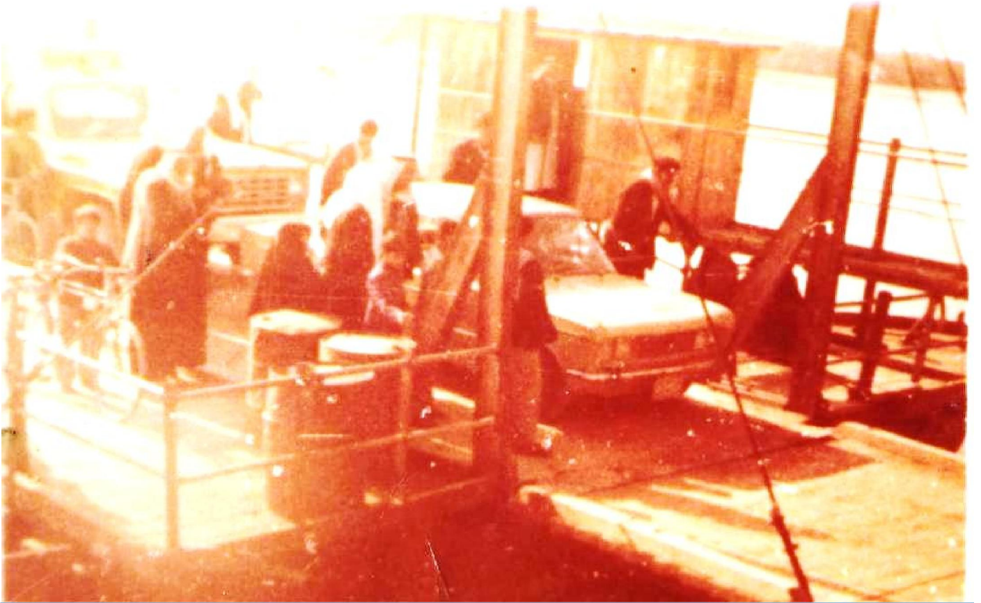
العبرة في هيت

المصادر: ١. بواسطة سفيان منصور. (٢٠٠٦). العبرة: هي واسطة للنقل النهري.