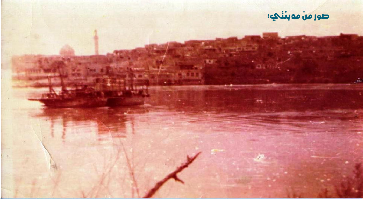
العبرة في هيت