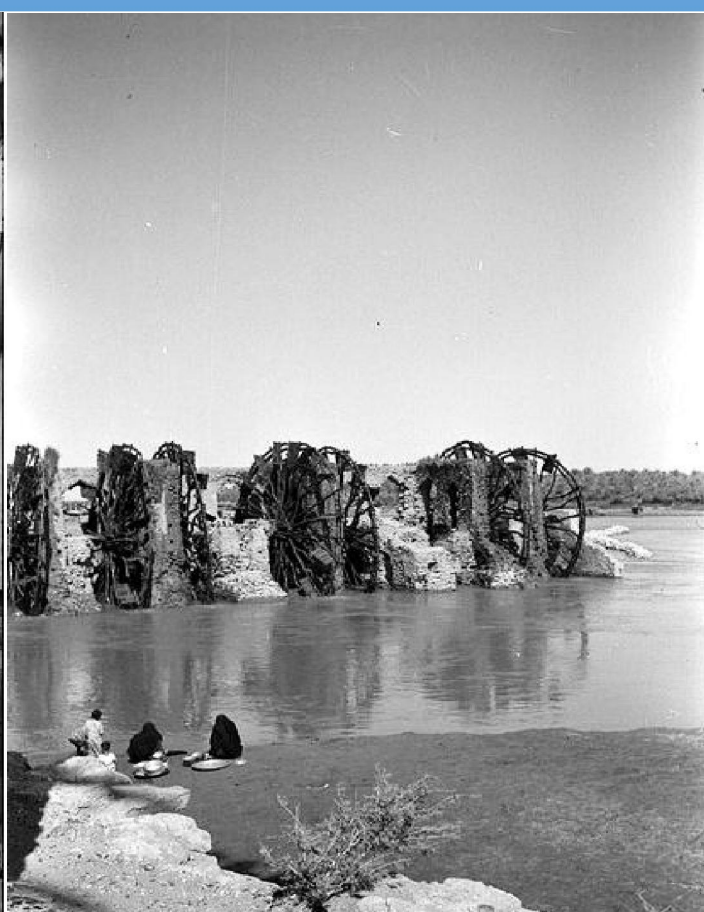
نواعير مقهى الشاقوفة سنة ١٩٥٥

المصادر: ١. محمد خيرى كريم. صور نواعير مقهى الشاقوفة في هيت في بلاد ما بين النهرين بعدسة وم دوسيل (١٩٥٥)، امستردام.