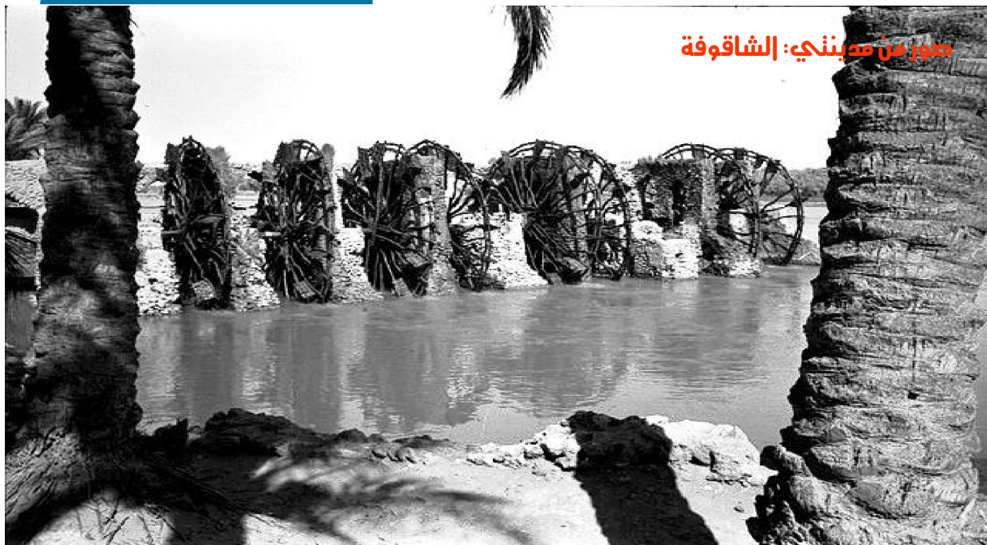
نواعير مقهى الشاقوفة – ١٩٥٥