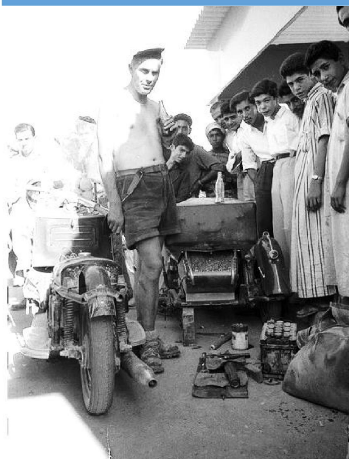
المصور وم دوسيل في هيت سنة ١٩٥٥