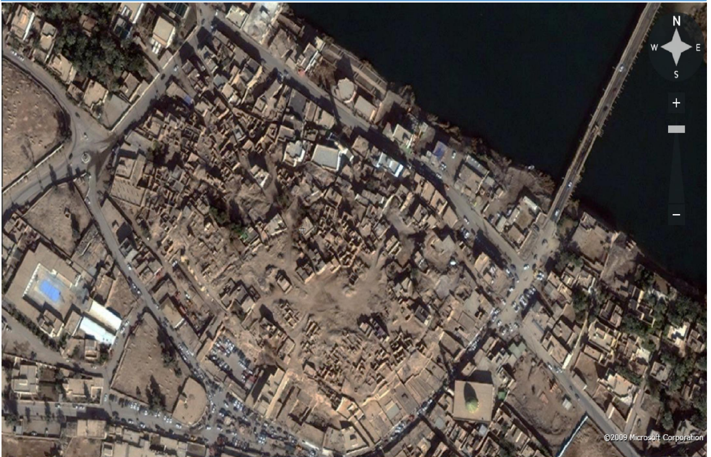
قلعة هيت من الجو سنة ٢٠١١ (٢)