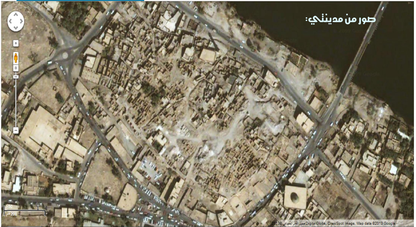
قلعة هيت سنة ٢٠٠٣ من الجو (١)