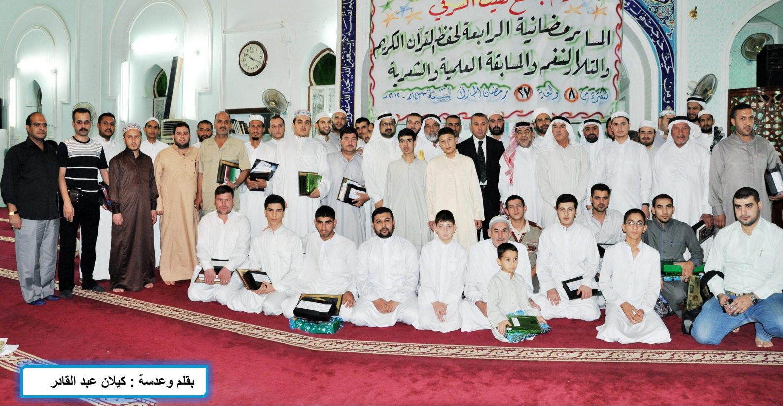
بقلم وعدسة : كيلان عبد القادر