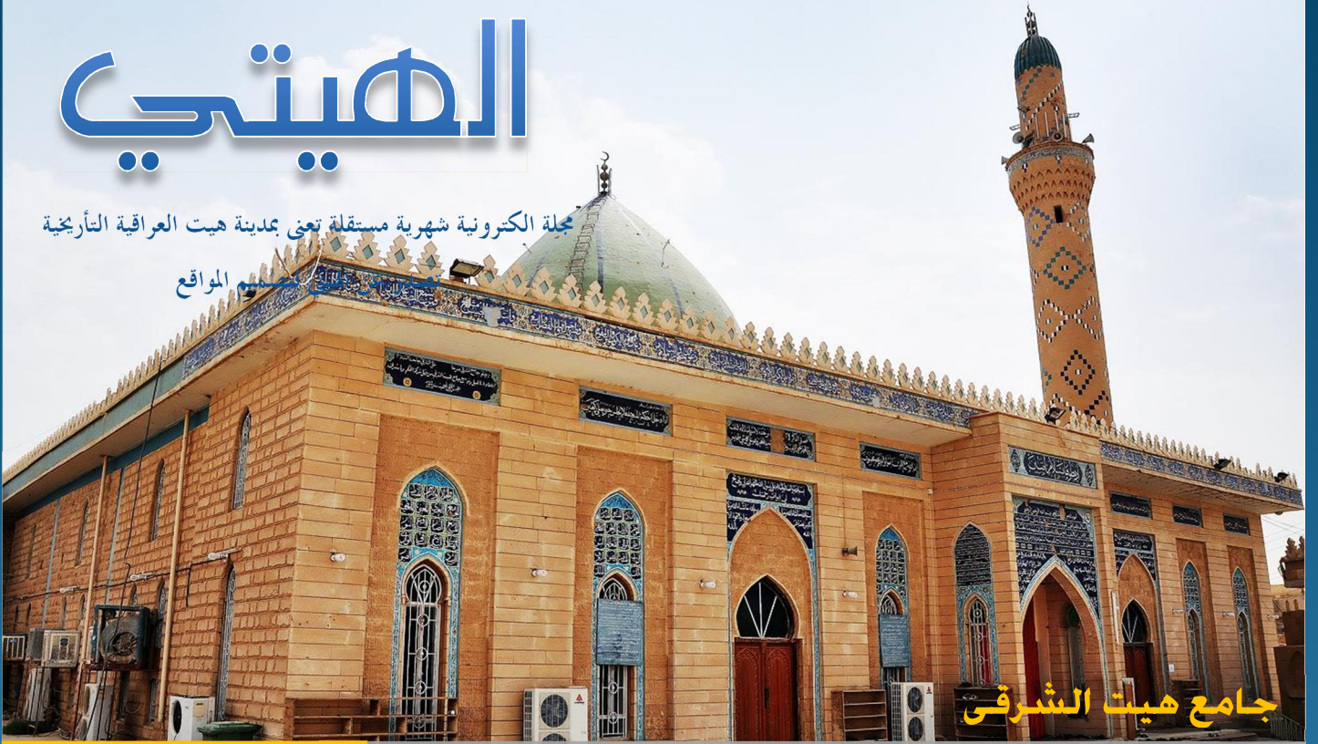
جامع هيت الشرقي

مجلة الكترونية شهرية مستقلة تعنى بمدينة هيت العراقية التاريخية مركزها الثقافي والفني