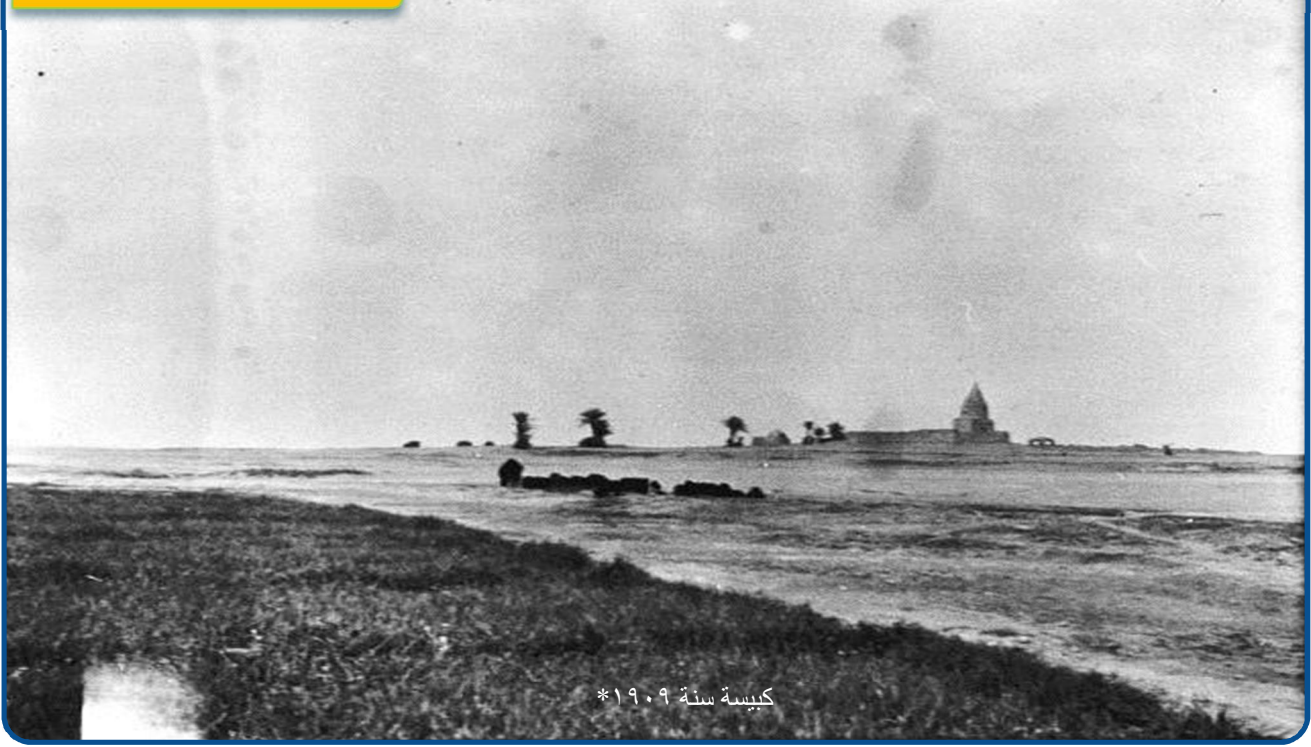
كبيسة سنة ١٩٠٩*

تقع ناحية كبيسة غرب مدينة هيت، وتبعد عنها مسافة ٢٠ كم تقريباً، أستحدثت الناحية بموجب المرسوم الجمهوري المرقم ٤٩٨ في عام ١٩٧٤م، وبدأت وزارة المالية بإجراء التقدير العام لتخمين إيرادات العقارات في كبيسة عندما كانت قرية في ١ / ١٠ / ١٩٦٢م. وتبلغ مساحتها ٢٤٠١ كم ٢ وتمثل نسبة ٢% من مجموع مساحة محافظة الأنبار. بدأت ناحية كبيسة قرية، ثم نمت وتطورت فأصبحت مدينة في فترة الحكم العثماني، وقد ذكرها ياقوت الحموي في معجمه، قال: (أما في طريق البادية، وإن قربها قرى صغيرة عسرة العيش). وقد مرت فيها المسيل عامي ١٩٠٩م و ١٩١٨م عند مرورها بمدينة هيت وقدرت عدد النخيل فيها بنحو ألف نخلة.