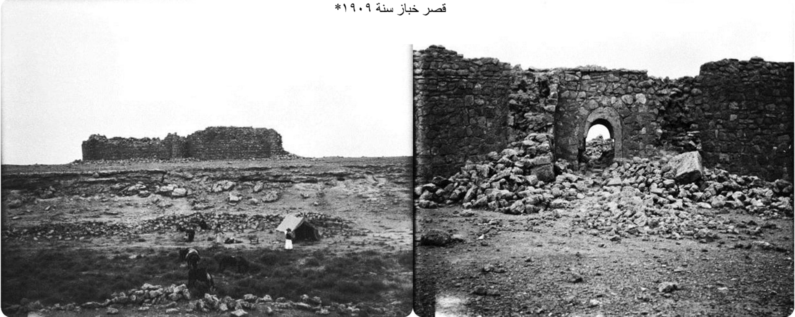
قصر خباز سنة ١٩٠٩*

ومن كبيسة أنفذ القائد خالد بن الوليد إلى بلاد الشام ليشترك في تحرير بلاد الشام ومنها أخذ دليلاً يسمى أبو ليلى، وقد كانت هي طريق القوافل المتنقلة بين بلاد الشام وبين العراق والخليج العربي. وتسكن كبيسة عدة عشائر عربية منها الكبيسات وثمر وعثرة والعزة. أما عشيرة الكبيسات فهي سبع عشائر متحالفة منذ قرون في كبيسة ونخوهم (عيال المجنونة) ويتنشر أبنائها اليوم في كبيسة والرطبة والرمادي والفلوجة وبغداد والوطن العربي وعشائر الكبيسات هي: الدريعات من الفضول من طيء. أبو شديد من الجماجمة من الموالي. المثلثة من جيس من بني عامر بن صعصعة. الحاج عيسى من المثلثة من جيس من بني عامر بن صعصعة. أبو حيدر من طيء، أبو حمد من العبيد من زبيد. أبو فرج (من اللهب من زبيد). اشتهرت مدينة كبيسة التي ينتسب لها العراقيون "الكبيسيون" بوجود عدة عيون للماء خارج بناياتها، وتحيط بتلك العيون بساتين النخيل الواسعة والتي تقدر بأكثر من عشرة آلاف نخلة حالياً، ومن تلك العيون وأشهرها عين كبيسة وعين الجربة، والمياه التي تخرج من عيونها توصف بالمياه الكبريتية، ويعطها تلونها المستمر بحسب درجات الحرارة وتفاعل المياه الكبريتية معها لواناً متعددة في الليل والنهار. ويوجد في كبيسة واحد من أهم معامل الاسمنت في العراق وهو معمل سميت كبيسة. كما أن كبيسة خرجت المئات من العلماء والدعاة والمفكرين والسياسيين وقد كان منها رئيس الوزراء العراقي عبد الرزاق الكبيسي، كما أن منها الداعية الشهير الشيخ أحمد الكبيسي ومحمد عياش الكبيسي وعبد السلام الكبيسي وغيرهم.