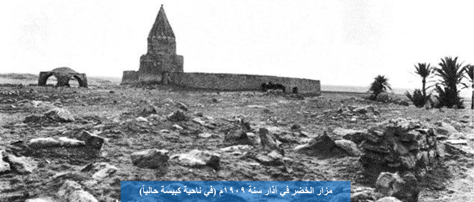
مزار الخضر في آذار سنة ١٩٠٩م (في ناحية كبيسة حالياً)