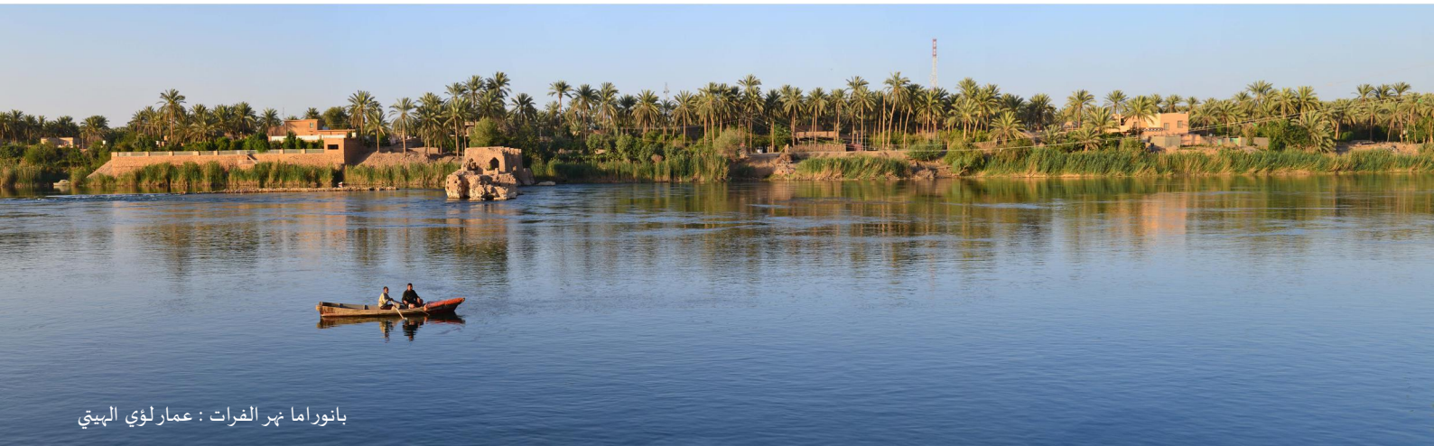
بانوراما نهر الفرات : عمار لؤي الهيتي

١ - معجم البابطين لشعراء العربية في القرنين التاسع عشر والعشرين. المملكة العربية السعودية.