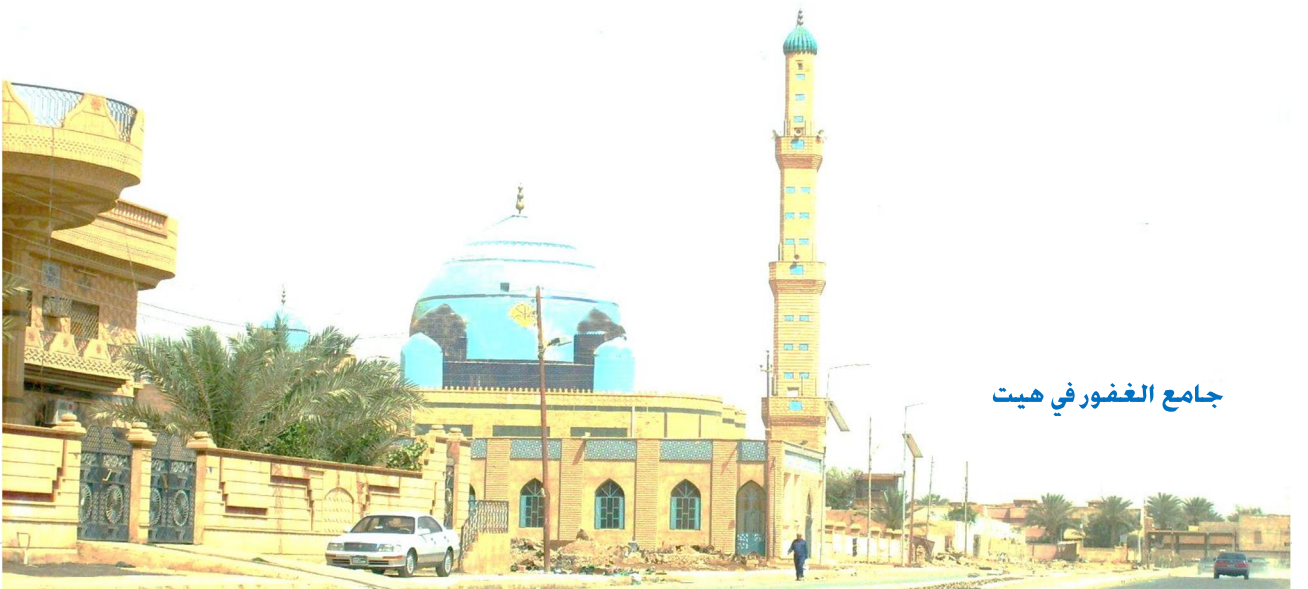
جامع الغفور في هيت

إن أصاب القوم مكروه جرى ومراثي الشعر في الشيخ لنا يدفنون الناس في ترب لهم أريحي الطبع محبوب الوري صدق المأثور من قول لنا حزننا حزان لم ترتق لنا لي أمور مبركات بعدهم لا تلوموا طبع نفس جزعت جامع الغفور فليشهد لنا في أعالي الخلد يعلو بيته