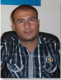
بقلم : رواد علي رحال العبيدي

تم افتتاح إعدادية التمريض للبنات في هيت للعام ٢٠١٢/٢٠١١ ويعتبر أول مشروع من نوعه في قضاء هيت، وبذلت جهود كبيرة من قبل دائرة صحة الانبار، وقائممقامية هيت، والمجلس المحلي للقضاء، ومتابعتهم ودورهم الفاعل في افتتاح الإعدادية وإنجاح هذا المشروع. إذ استقطب عدد من الطالبات الراغبات في دراسة المهنة التمريضية من قضاء هيت وجميع النواحي والقرى التابعة له، وان عدداً الطالبات اللواتي تم قبولهن (أربعة وأربعون طالبة) من عدد (سبعين) من المتقدمات للدراسة فيها، وتم اعتماد مبدأ المنافسة وجمع النقاط في اختيارهن ومن اللواتي أكملن المرحلة المتوسطة.