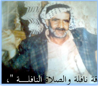
اعداد: قيس خليل عطيه