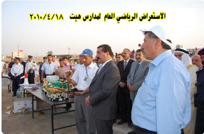
الاستعراض الرياضي العام لمدارس هيت ٢٠١٠/٤/١٨