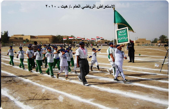
الاستعراض الرياضي العام - هيت - ٢٠١٠