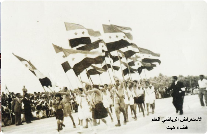
الاستعراض الرياضي العام قضاء هيت