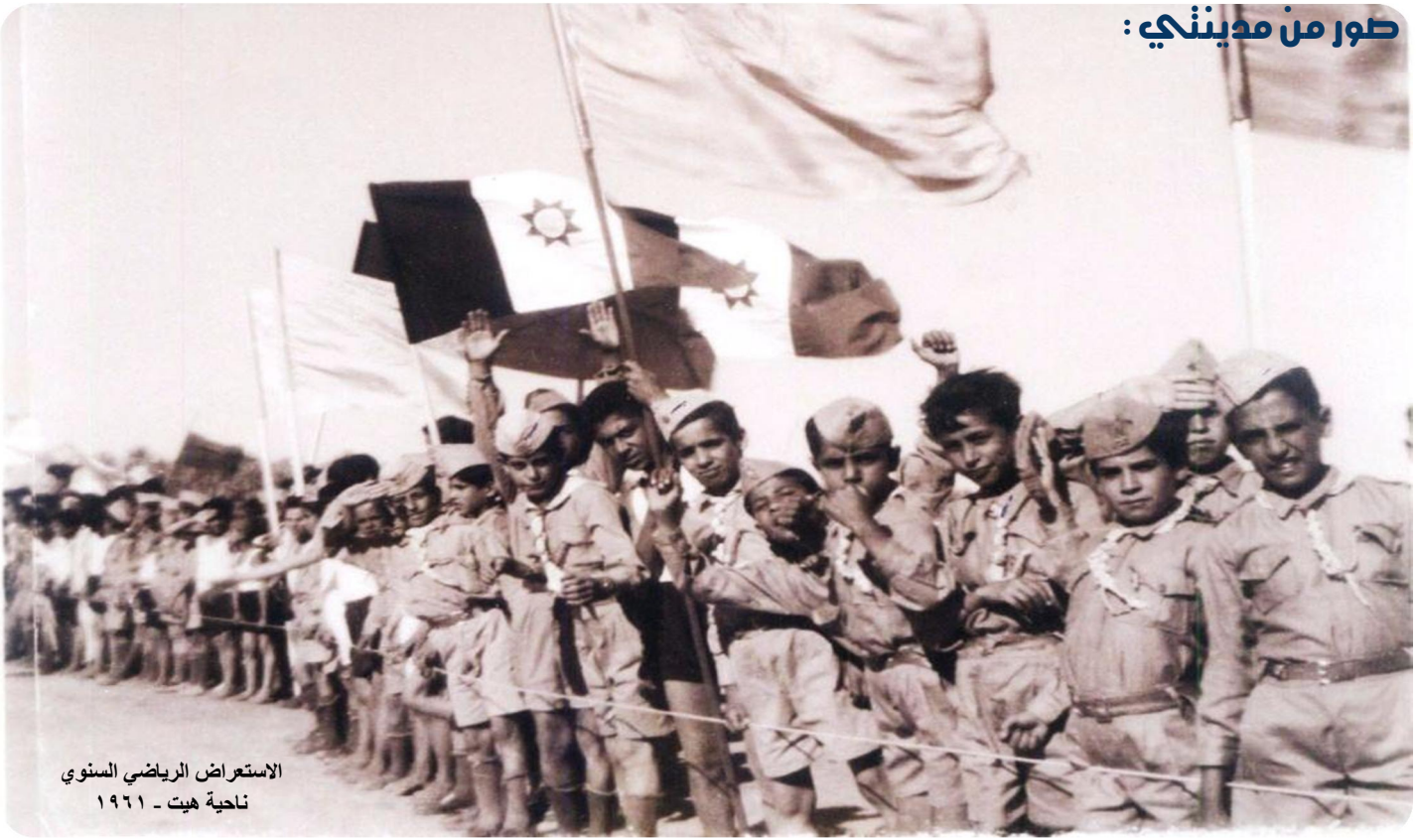
الاستعراض الرياضي السنوي ناحية هيت - ١٩٦١