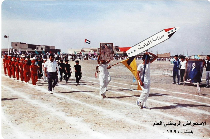
الاستعراض الرياضي العام هيت - ١٩٩٠