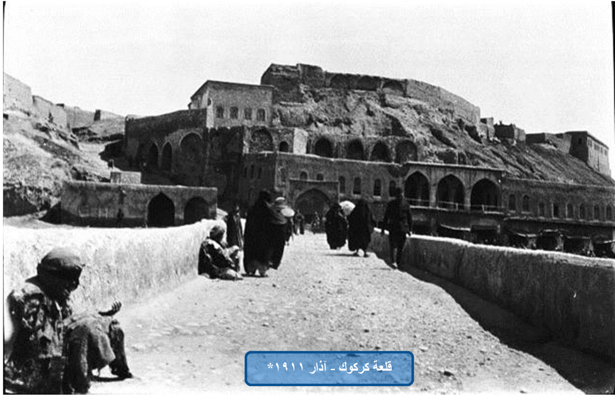
قلعة كركوك - آذار ١٩١١*

تقع شمال بغداد على مسافة ٢٥٠ كم، وتشير المصادر الأثرية والتاريخية إلى أن السومريين والأكديين هم أول من سكن المنطقة، وتبعهم البابليون والميتانيون والآشوريون والكلديون، وأقدم ذكر لمدينة كركوك في الألواح المسمارية التي عثر عليها عام ١٩٢٢ صدفة في قلعة كركوك، باسم (أرابخا)، ويبدو أن أصل الاسم هو (أربخا)، ثم حُرِّف إلى (أراقا)، وقيل أن الاسم مأخوذ من الكلمة الآرامية: (ربخا)، بمعنى: الحبل الذي فيه عرى يشد به الحروف. إن تاريخ المدينة يرتقي فعلاً إلى منتصف الألف الثاني قبل الميلاد، وإن ذكر (أرابخا) يرجع إلى عهد الملك البابلي حمورابي، ولقد عرفت كركوك لدى أهاليها قديماً باسم (عرفه)، وهي من مناطق المدينة الحالية، أما المصادر الآشورية، فتذكر أنها كانت مركزاً لعبادة إله الرعد والأمطار (آدد)، كما أن الملك الآشوري اشور، هو الذي بنى قلعتها قبل عام ٨٥٠ ق.م والمصادر اليونانية عرفتها أو بالأحرى ذكرتها باسم (أربخيوس).