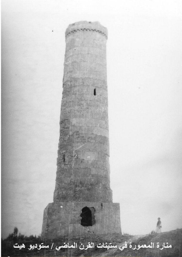
منارة المعمورة في ستينات القرن الماضي