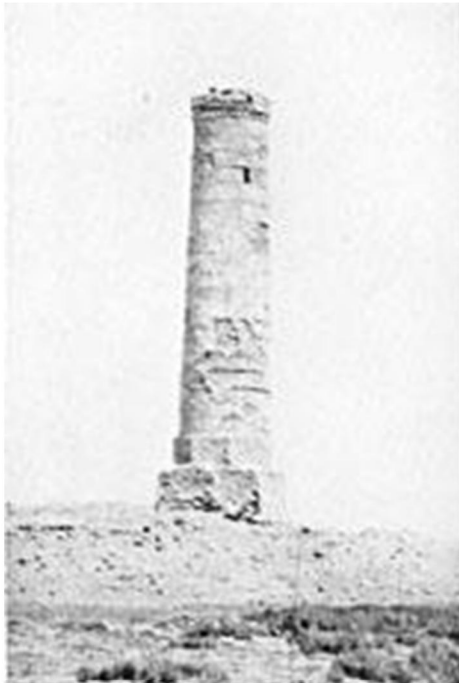
منارة المعمورة سنة ١٩٠٩م مع مخطط بالأمتار نشر سنة ١٩١١م في بريطانيا (٢)

وتبقى مدينة هيت القديمة بقلعتها الشائخة ومنارة جامع الفاروق ومنارة المعمورة لغزاً لأهل التراث، لأن ماكتب عن هيت قليل جداً، ونحن إذ ننقل لكم بعض ما أبحاثه أوراق الماضي؛ لنضع بين أيديكم معلومات ربما أوقفت الكثير وجعلتهم يتسائلون، كيف كانت هيت وما حولها؟، وكتبت المسز بيل في كتابها (من أمورا إلى أمورا): على مسافة ساعة مشياً على الأقدام جنوب غرب هيت تقع بقايا قرية متجمعة حول منارة المعمورة، وكل الأبنية صنعت من حجارة صغيرة غير مربعة الشكل مع المورتر (النورة أشبه بالأسمنت)، وتبدو المنارة متهرية من الخارج، ويبدو أنها بنيت من حجارة كبيرة والنورة، لحمت سوية بجزم قبل وضعها في مكانها، يضيق حول البرج باتجاه الأعلى وينتهي بزخارف متعرجة في الأعلى، وضعت فوق تركيب ثنائي واطيء يستند على قاعدة مربعة الشكل، وتقول المسز بيل: (تسلقت درجات ملتوية لمسح المنطقة، وبشكل لا يصدق أنها هجرت، القرية فارغة وتقع إلى الغرب منها بساتين نخيل كبيسة التي تظهر كرشاش أسود على الأرض، ويظهر دخان كثيف من أفران قير هيت، وسبخة الكبريت كقشرة تتلألأ تحت الشمس، المنظر مؤذي لا يمكن اصطلاحه، مع مراقدة صغيرة للموتى متناثرة أشبه بدعاء استرضائي بين لمعان الأملاح)، مما لا يدع مجالاً للشك أن المعمورة كانت خالية من السكان سنة ١٩٠٩م عندما مرت بها هذه المستكشفة الانكليزية.