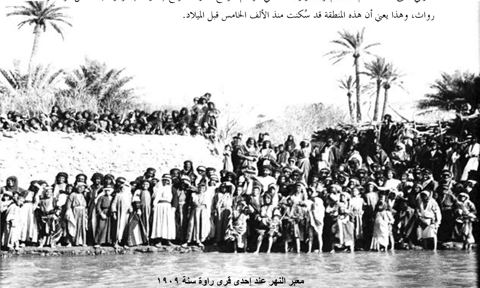
معبر النهر عند إحدى قرى راوة سنة ١٩٠٩

تقع راوة على الضفة اليسرى من نهر الفرات وتقابل مدينة عنه، وتبعد عنها مسافة ٥ كم شرقاً، وأصبحت ناحية بموجب المرسوم الجمهوري المرقم ٥٢٥ والمؤرخ في ١٩٦٠/٨/٣١، وهي الآن قضاء، تبلغ مساحتها ٥٧٧٢ كم ٢ ، نشأت قرية صغيرة وأخذت في النمو والتوسع؛ نظراً لوقوعها على ضفة نهر الفرات، وقد شيد فيها الوالي العثماني مدحت باشا سنة ١٨٦٩ م قلعة فخمة، واستمرت بالنمو والتوسع، ويرجع تأريخ هذه المنطقة إلى العصر البابلي القديم ٢٠٠٠-١٦٠٠ ق.م، والعصر الآشوري ٩١١-٦١٢ ق.م، وفترة الاحتلال الروماني، وفترة الاحتلال الفرثي حتى ١٤٨ ق.م-١٢٦ م والتحرير الاسلامي، وأهم المواقع الأثرية: موقع (الدرجية)، ومركب عجيل، وأبو رواث، وهذا يعني أن هذه المنطقة قد سكنت منذ الألف الخامس قبل الميلاد.