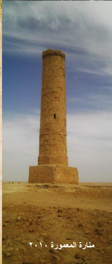
منارة المعمورة ٢٠١٠