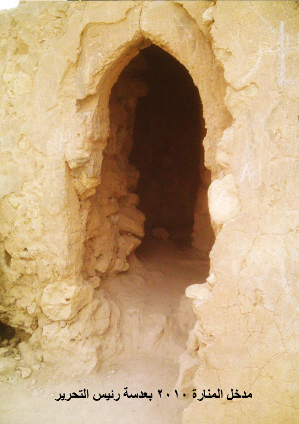
مدخل المنارة ٢٠١٠