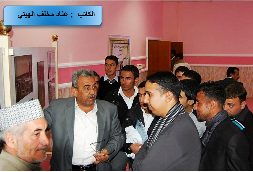
الكاتب : عناد مخلف الهيئي