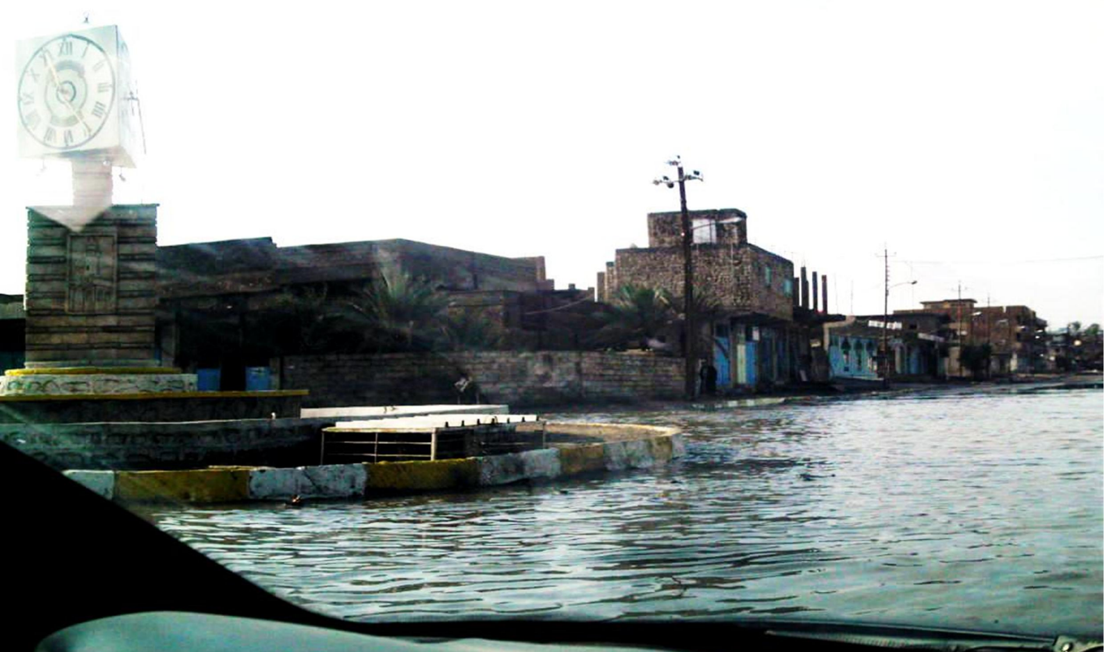
ساعة هيت القديمة التي أنشأت في سنة ١٩٩٨ ودمرت في سنة ٢٠٠٦ - صورة بعد تساقط الأمطار بعدسة رئيس التحرير