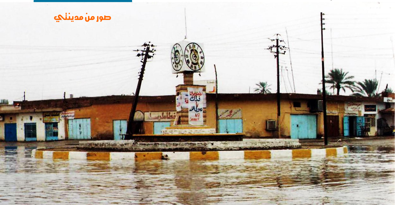
فلانة ساعة هيت القديمة بعد تساقط الأمطار – مدينة هيت في ٢ شباط ٢٠٠٦