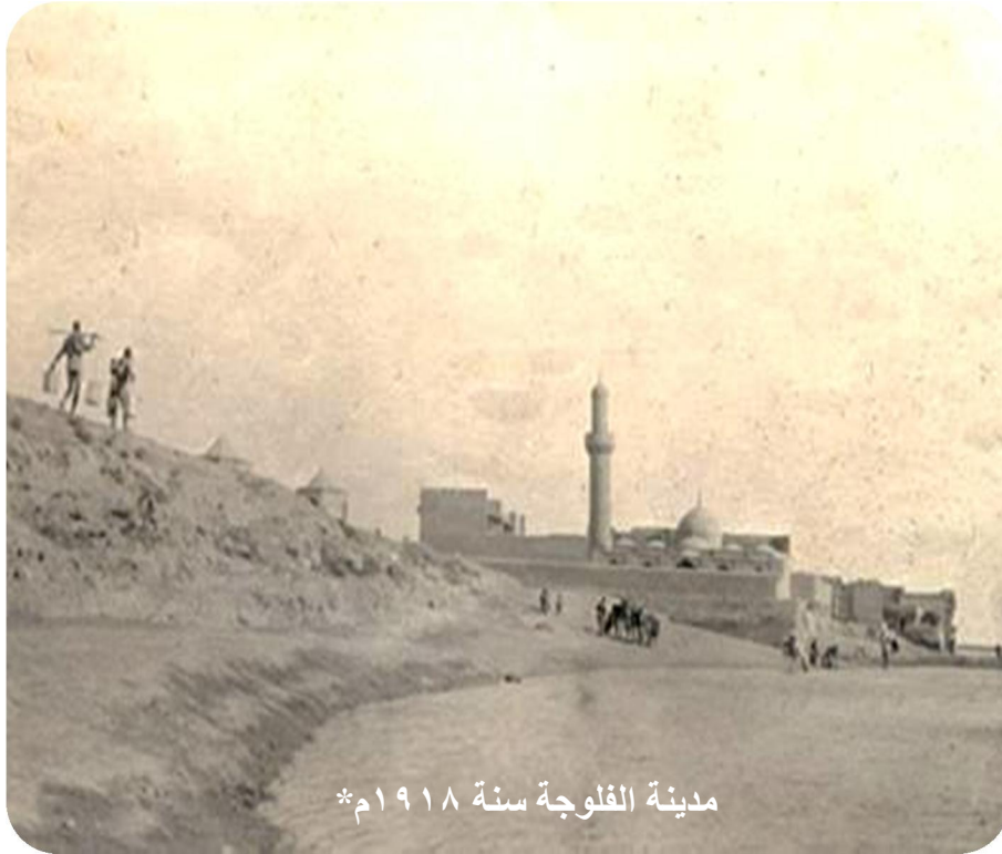
مدينة الفلوجة سنة ١٩١٨م*

و لم تكن الفلوجة في العصر العثماني سوى قرية صغيرة يسكنها بعض المزارعين، لأنها تقع على الضفة الشرقية من نهر الفرات، ولخصوبة أراضيها وجودة المنتج الزراعي اتسوطن الكثير من المزارعين بالقرب منها، مما أدى إلى تطورها وبالتالي توسعها، وتشتهر المدينة بزراعة انواع مختلفة من المزروعات وتشتهر بمطاعمها. لقد تأسست أول مكتبة عامة عام ١٩٥٧م بينما تأسس أول مركز للشباب في عام ١٩٧٩م، وللفلوجة أهمية سياحية متمثلة بوجود موقعين سياحيين بالقرب منها وهما مدينة الحبانية السياحية وبحيرة الثرثار.